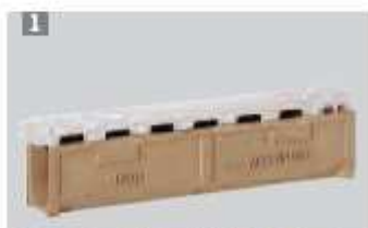
1 Korytko odwodnieniowe LW 125, w łuku, 1 m, z przykryciem z tworzywa sztucznego.