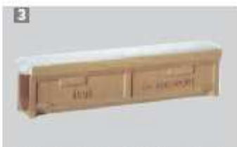
3 Korytko odwodnieniowe LW 125, proste, 1 m, z przykryciem z tworzywa sztucznego, z jednostronnie podwyższoną krawędzią.