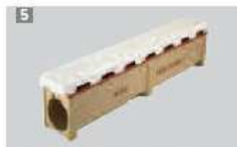
5 Korytko szczelinowe, w łuku, 1 m, z przykryciem z tworzywa sztucznego.