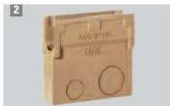
2 Skrzynka odpływowa do korytek LW 125.