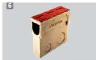
6 Skrzynka odpływowa do korytek szczelinowych.