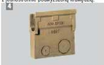
4 Skrzynka odpływowa do korytek LW 125, z jednostronnie podwyższoną krawędzią.